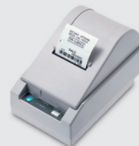
Etikettendrucker TM-L60 II

EPSON Deutschland GmbH • Otto-Hahn-Str. 4 • D-40670 Meerbusch • www.epson.de